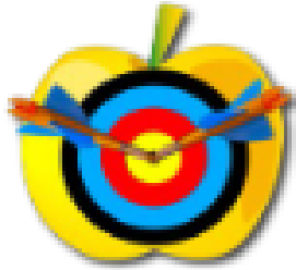
Gold Archery Centre Ouest Archery